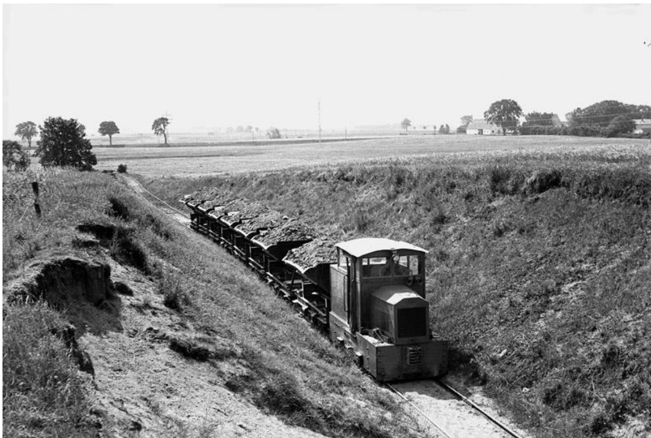
Teglværkstog ved Hammersholt.

Der var to teglværker i Hammersholt i gennem mange år. Når sæsonen startede, var der 250 mænd og kvinder beskæftiget med teglværksarbejdet. Mange var svenskere (derfor "Lille Sverige") samt en del polakker. Teglværkerne lukkede og de mange teglværksarbejdere forsvandt og dermed grundlaget for bl.a. de 2 købmandsforretninger. Forsamlingshuset har overlevet som samlingssted frem til i dag. Hammersholt Erhvervspark blev anlagt på det gamle teglværksområde; men denne er aldrig på samme måde blevet en del af lokalsamfundet. (se i øvrigt Anders Bohns beretning om området historie på lokalrådets hjemmeside ).